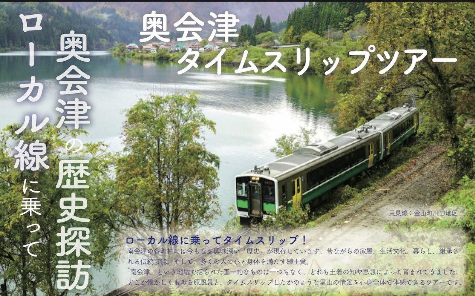
只見線：金山町川口地区