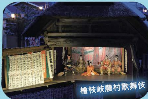
檜枝岐農村歌舞伎

約270年余りにわたって村民に継承される農村歌舞伎。裏方から出演まですべて村民の手作り