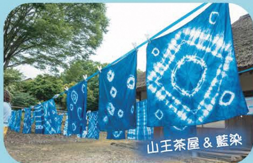
山王茶屋 & 藍染

南会津の各町村には今もなお興味深い「歴史」が現存しています。昔ながらの家屋、生活文化、暮らし、継承される伝統芸能。そして、多くの人の心と身体を満たす郷土食。「南会津」という地域で括られた画一的なもの一つもなく、どれも土着の知や思想によって育まれてきました。どこか懐かしきもある原風景と、タイムスリップしたかのような里山の情景を心身全体で体感できるツアーです。