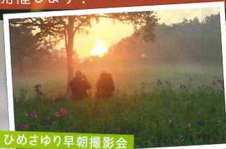
ひめさゆり早朝撮影会