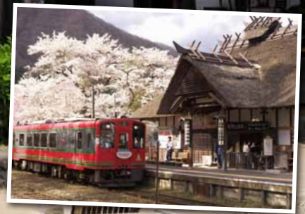
湯野上温泉駅とAIZUマウントエクスプレス