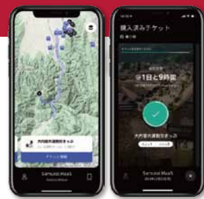
会津 samurai MaaS