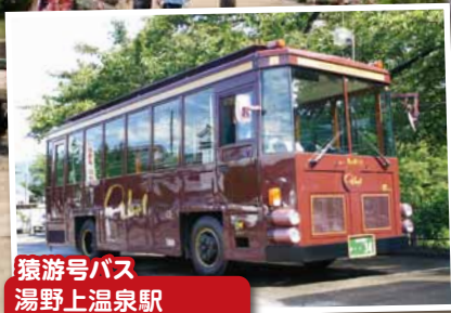
猿游号バス 湯野上温泉駅 ～大内宿間運行