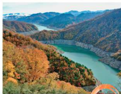
燃えるように色づく紅葉 田子倉湖 見学 ダムサイトから眺める山々の紅葉、湖面に映る紅葉は見事です。