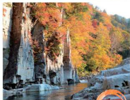
伊南川沿いにそびえ立つ奇岩 屏風岩 見学 急流が長い歳月をかけて形成した奇岩が天を突くようにそそり立ち、その白い岩肌にも赤く染まった紅葉が映えます。