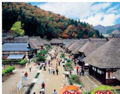
茅葺の宿場町 大内宿 自由散策 自由昼食 戦国～江戸時代に宿場町として栄え、現在は約500mの道の両側に約40軒の茅葺き屋根の家屋が並んでいます。