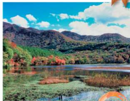
水鏡に映る絶景の紅葉 観音沼森林公園 見学 山を彩る紅葉が、鏡のような沼の水面に映し出される神秘的な紅葉美をお楽しみください。