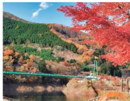
塩原渓谷の大自然の眺望 もみじ谷大吊橋 見学 塩原渓谷にかかる全長320mのもみじ谷大吊橋。赤や黄色に色づいた360度の紅葉パノラマ空中散歩!