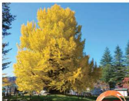
一面を黄金色に染める 古町の大きいちょう 見学 樹齢800年、樹高35m、根廻り16m、目通り11mという堂々とした姿です。福島県の天然記念物に指定されています。