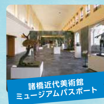
諸橋近代美術館 ミュージアムパスポート

いわき市にある東北最大級の楽しく学べる体験型水族館。潮目の海をテーマに800種を超える生物を展示しています。