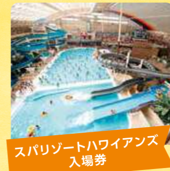
スパリゾートハワイアンズ 入場券

いわき市にある大型温水プール・温泉・ホテル・ゴルフ場からなる大型レジャー施設です。