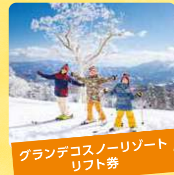
グランデコスノーリゾート リフト券

郡山市にあるレジャー施設。園内には、ドリームランド、プール(夏季のみ)やカルチャーセンターなどがあります。