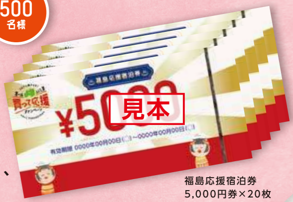
福島応援宿泊券 5,000円券×20枚

福島県は全国第4位の温泉地数! 「新しい生活様式」を取り入れながら、温泉地めぐりをお楽しみください!