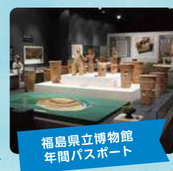
福島県立博物館 年間パスポート

北塩原村にある美術館。シュルレアリスムの巨匠サルバドール・ダリの作品において、アジア最大級の収蔵数を誇ります。