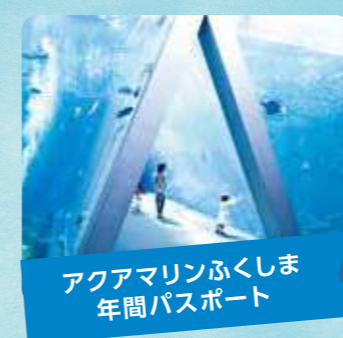
アクアマリンふくしま 年間パスポート

いわき市にある東北最大級の楽しく学べる体験型水族館。潮目の海をテーマに800種を超える生物を展示しています。