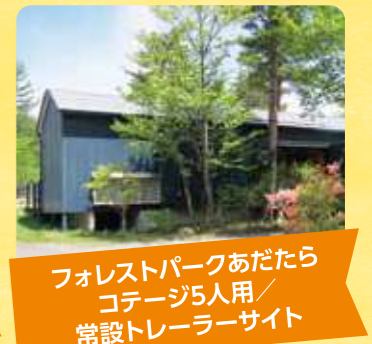
フォレストパークあだたら コテージ5人用/常設トレーラーサイト

裏磐梯にある、大自然に囲まれたリゾート施設。冬はパウダースノーが広がるゲレンデでスキーを楽しめます。