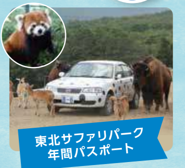
東北サファリパーク 年間パスポート

会津若松市にある県立の博物館。福島県の古代から現代までの歴史、民俗資料、自然資料を大規模に展示しています。