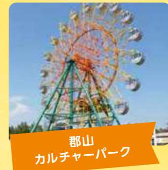
郡山 カルチャーパーク

いわき市にある大型温水プール・温泉・ホテル・ゴルフ場からなる大型レジャー施設です。