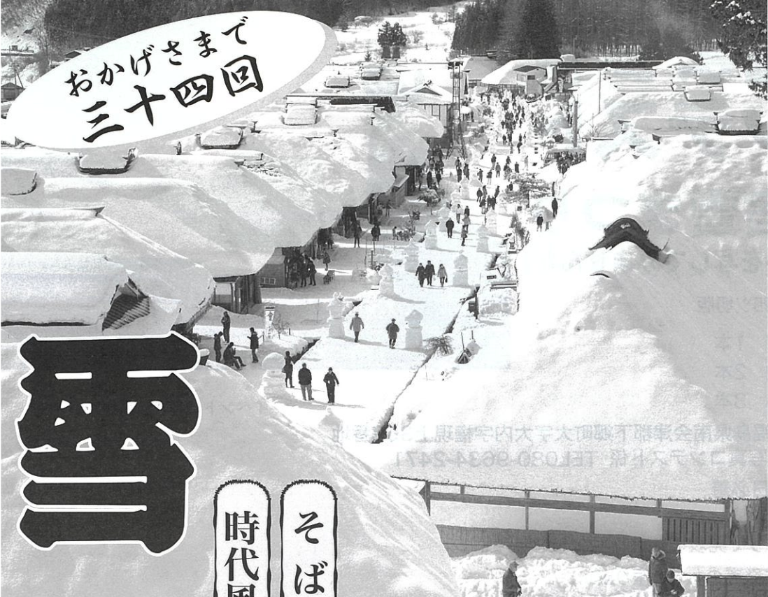
大内宿雪まつり風景