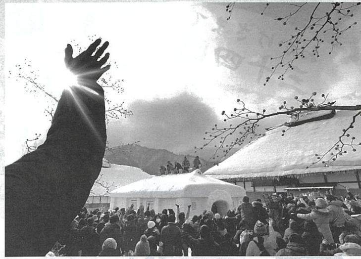
前回の金賞作品 「イベントに輝き」 矢作 武一様