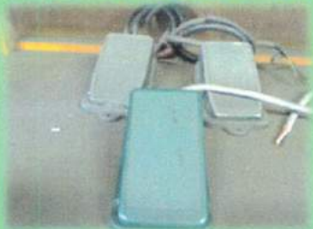
デットマン踏みスイッチ