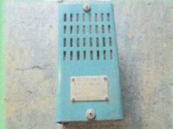
BZ21警報器ブザー装置