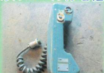
オルゴール付増幅器