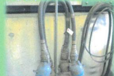
電気ジャンパー管