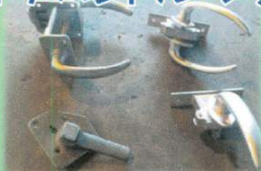
ドアハンドル・ラッチ