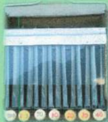
コインカウンター