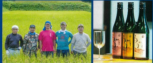
米作りからこだわった今人気の奥只見の米焼酎