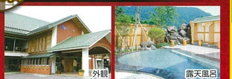
大自然の中にある露天風呂は、疲れた体を温め、 疲れを癒し、四季の景色もお楽しみいただけます。