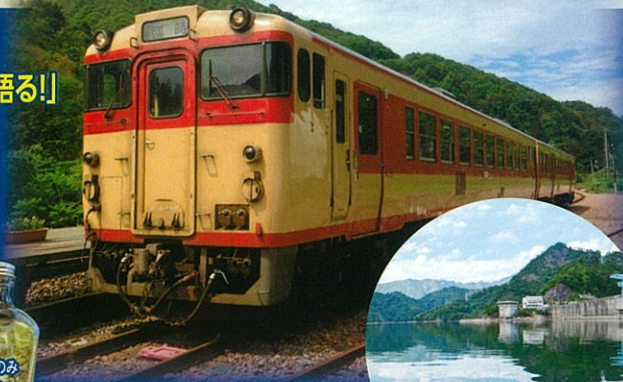
田子倉湖で遊覧船に乗船します!