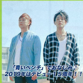
「青いベンチ」でおなじみ♪ 2019年はデビュー15周年!!