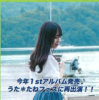
今年1stアルバム発売♪ うた*たねフェスに再出演!!