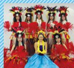
フラグランス ルークラウラーズ 29日