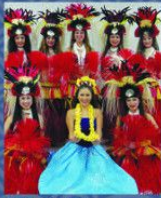
フラダンス ハーワラウラーナ 29日