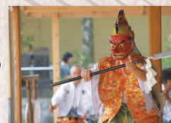
太々御神楽奉納 24日後祭時「神楽殿」神楽 破魔矢・神楽餅まきがある。