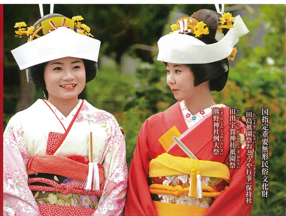
国指定重要無形民俗文化財 「田島祇園祭おとや行事」保持社 田出宇賀神社祇園祭 熊野神社例大祭

身を浄め花嫁衣裳を身に纏い 神様の喜び給う供え物 7つの行器に満ち盛り 終始無言の厳肅なる神楽をおさめ 精魂籠めた神様へ供えし濁酒 身体の間々まで行き渡らせ 3日間の夏に疫病・災難・厄除け 良縁結び、長寿そして豊穰を願う