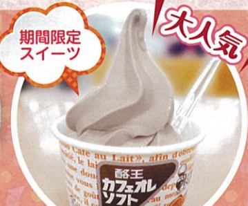
期間限定 スイーツ