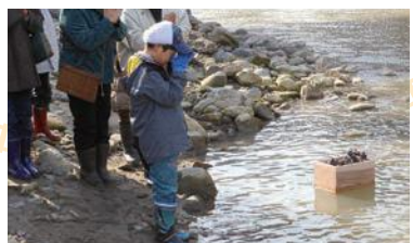
三島町高清水地区ひな流し ▲

三島町高清水地区で受け継がれ、毎年3月4日に無病息災を願い手作りの紙雛（紙で作った人形）を只見川に流します。