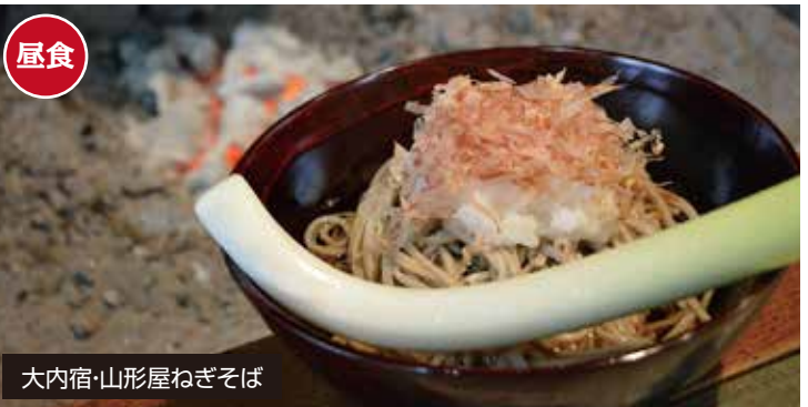
大内宿・山形屋ねぎそば

※道路状況の影響により運行内容が変更になる場合がありますので、予めご了承ください。 ※道路状況などにより多少の遅延がありますので、高速バス・列車等への乗り換えには十分な余裕をお取りください。