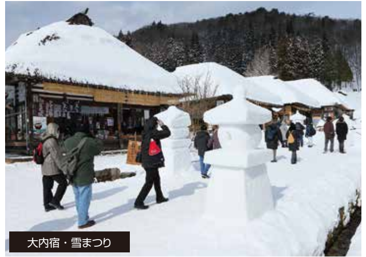
大内宿・雪まつり

難攻不落の名城とうたわれ、戊辰戦役で新政府軍の猛攻をしのいだ鶴ヶ城。昭和40年9月に再建され、平成23年春には幕末時代の瓦(赤瓦)をまとった日本で唯一の天守閣となりました。