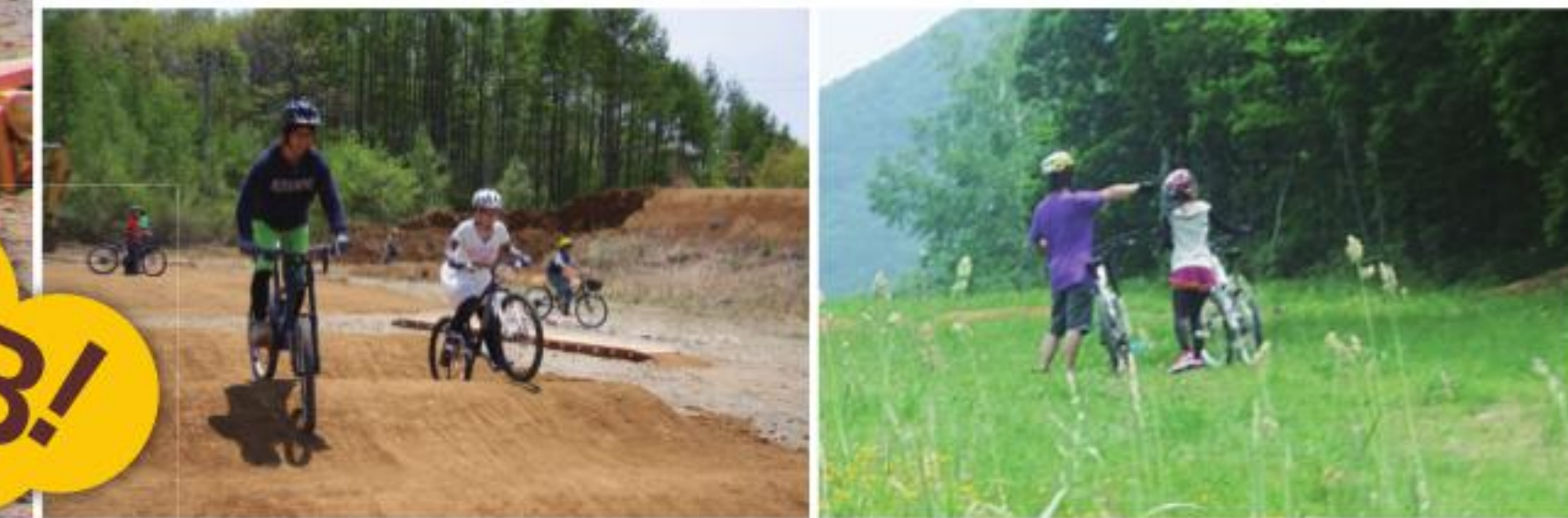
ダウンヒルコースやクロスカントリーコースなど、レベルに合わせたコースを走る

あいつこうげんたかつえマウンテンバイクリゾート MAP P2 C-3 インストラクターとレンタルバイク付きで、ビギナーでも気軽にマウンテンバイク体験が楽しめる。総面積65haの大自然の中、パノラマの眺めを楽しむダウンヒルコースや森林の中を駆け抜けるクロスカントリーコースを爽快に走ろう! ☎0241-78-3099 南会津郡南会津町高杖原535 5月中旬~11月上旬 9:00~16:00(天候により変更あり) 火曜 体験プラン(3時間/インストラクター付/MTBレンタル込) 大人5000円 子供3500円(料金変更の場合あり) ※保険料込