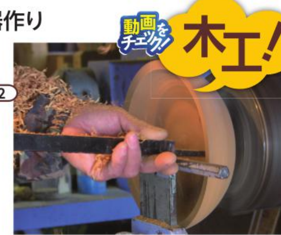
木地師に教わりながら器作りなどを楽しむ

きじこうぼう MAP P2 D-2 戸赤地区は300年以上昔から木地師が住むという土地。木地小屋は日本で唯一の水車式木工ろくろがある体験型施設。ろくろを使った菓子器作りや、炭焼き体験などを楽しもう。 ☎0241-67-4399 南会津郡下郷町大字戸赤字竹ノ子下856 9:00~16:00 水曜(体験は要予約) 木工ろくろ体験: 初回1500円、2回目以降1000円(材料費別途1000円)