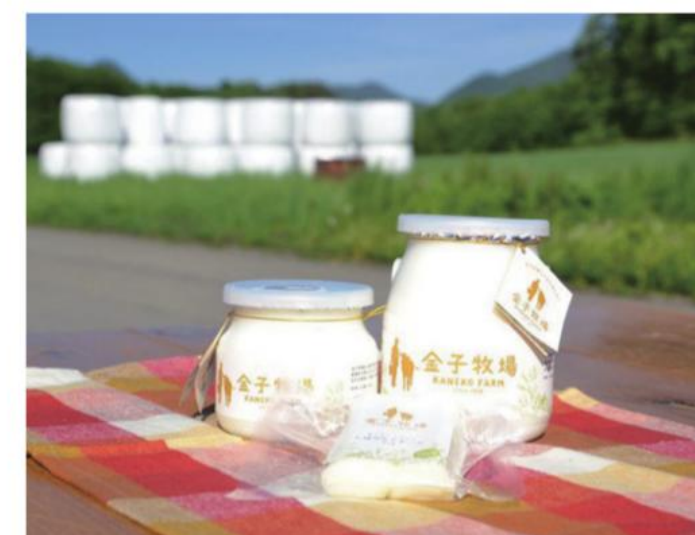
ふくしまおいしい大賞2014を受賞したプレーンヨーグルト

付いている物件は、「おいでよ!南会津。」のHPにて動画が公開されています。 http://www.aizu-concierge.com/ おいでよ南会津 検索